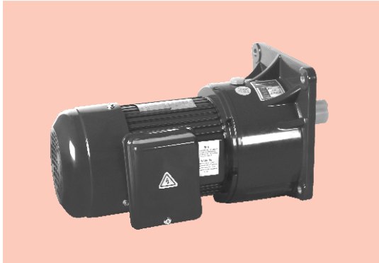
■ 立式 Vertical