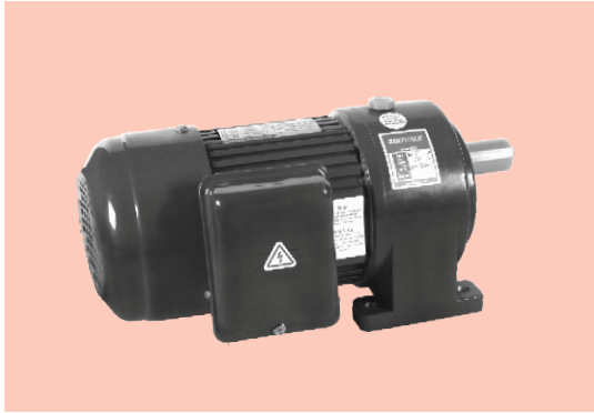
■ 卧式 Horizontal